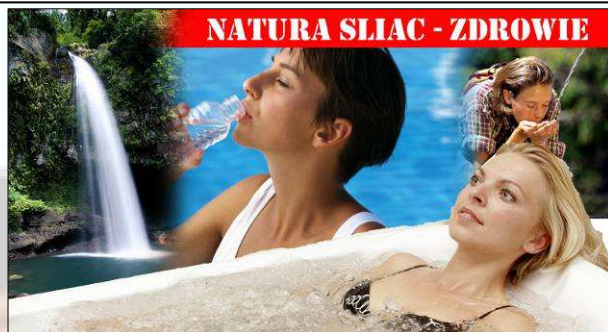
NATURA SLIAC - ZDROWIE

♥ Wygodne zakwaterowanie: w pochodzącym z połowy ubiegłego wieku, największym z obiektów uzdrowiska - „LD Pałac” Pokoje 1 i 2 osobowe z możliwością dostawek, w pokojach łazienka, lodówka, TV i radio, na miejscu: jadalnia, restauracja, klub, sala widowiskowa, gabinety fryzjerskie, butiki.. W budynku balneoterapii: kryty rehabilitacyjny basen termalny, gabinety zabiegowe i lekarskie, fitness, sauny!